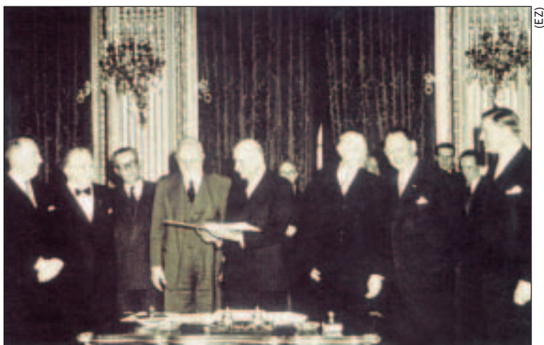
Potpisivanje Ugovora iz Pariza 18. travnja 1951.

Povelju o osnivanju Vijeća Europe potpisalo je deset zemalja: Belgija, Francuska, Luksemburg, Nizozemska, Velika Britanija, Irska, Italija, Danska, Norveška i Švedska. Promicanje demokracije, promicanje poštovanja ljudskih prava te promicanje pravne države definirani su kao temeljne zadaće Vijeća. Danas, pedeset i tri godine nakon osnivanja, Vijeće Europe broji četrdeset i četiri zemlje članice, među kojima su i sve zemlje članice Europske unije. Međutim, ubrzo nakon njegova osnivanja, postalo je jasno da Vijeće Europe, kao međunarodna organizacija koja djeluje prema načelima klasičnih međudržavnih odnosa, nije moglo dati pravi odgovor na rastuće izazove poratne Europe, te je, stoga, projekt ujedinjene Europe, koji je rezultirao stvaranjem Europske unije kakvu danas poznajemo, pokrenut na temeljima Schumanove deklaracije. Ipak, gledano iz današnje perspektive, kad se proces približavanja Europskoj uniji već proširio na srednju i istočnu Europu, očituje se temeljna važnost obiju institucija, i Vijeća Europe i Europske unije, u izgradnji ujedinjene Europe. Stoga u okviru Europskog tjedna podsjećamo na povijesnu važnost obaju datuma: i 9. svibnja, Dana Europe, i 5. svibnja, Dana Vijeća Europe.