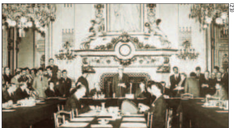
Čitanje deklaracije 9. svibnja 1950. u Parizu

Ovakav uspješan razvoj prvotne koncepcije ujedinjene Europe potaknuo je predsjednike država i vlada, okupljene na Milanskom summitu 28. i 29. lipnja 1985. godine, da, u znak sjećanja na povijesnu Schumanovu deklaraciju, proglase 9. svibnja Danom Europe .